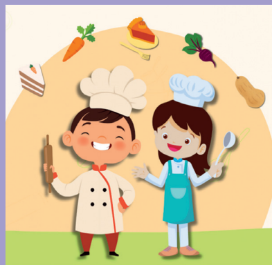
Visuel : La Cantine des halles